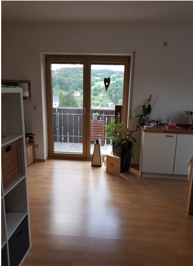
Ansicht Wohnzimmer mit Balkonzugang