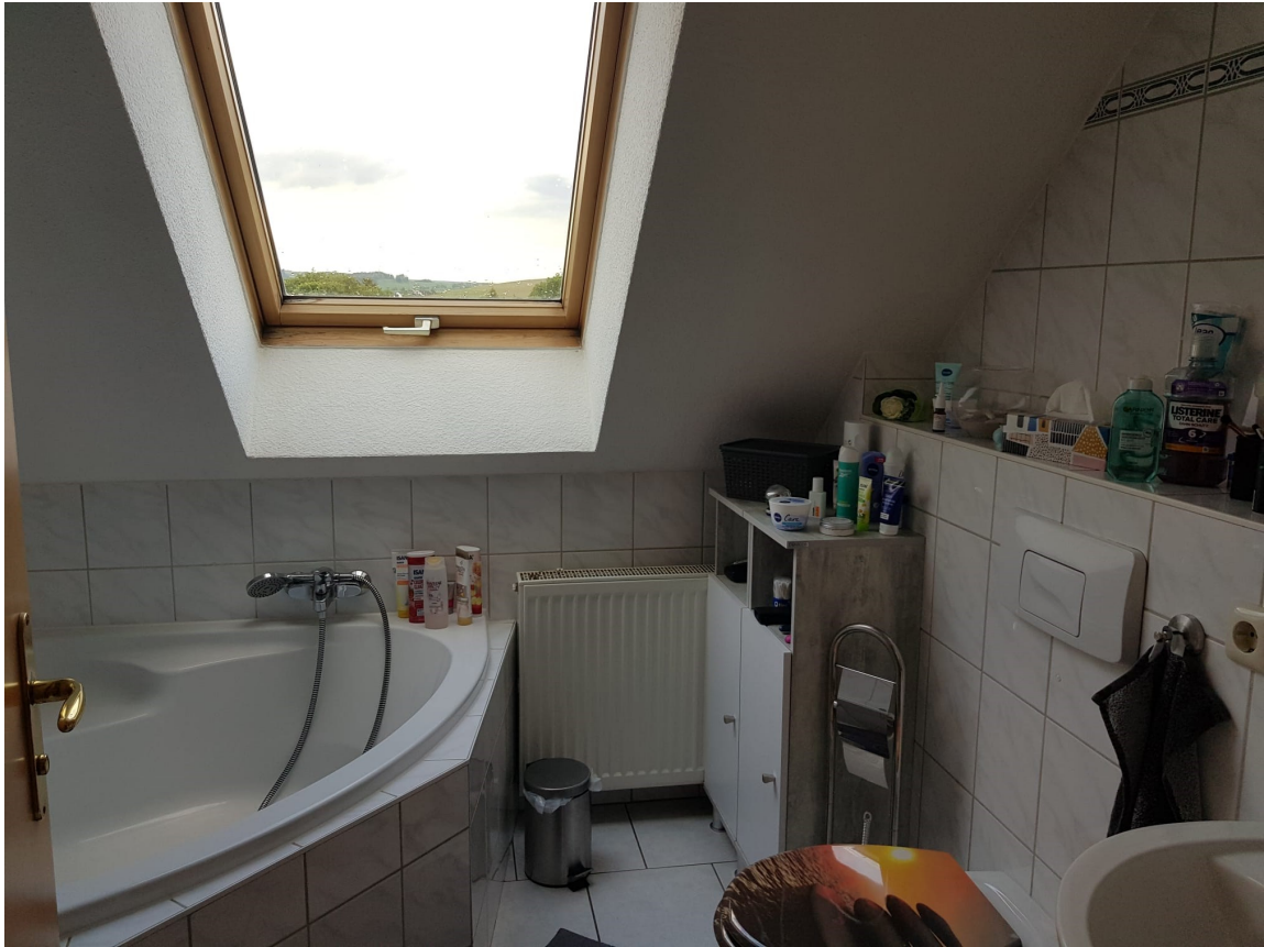
Ansicht Bad / WC