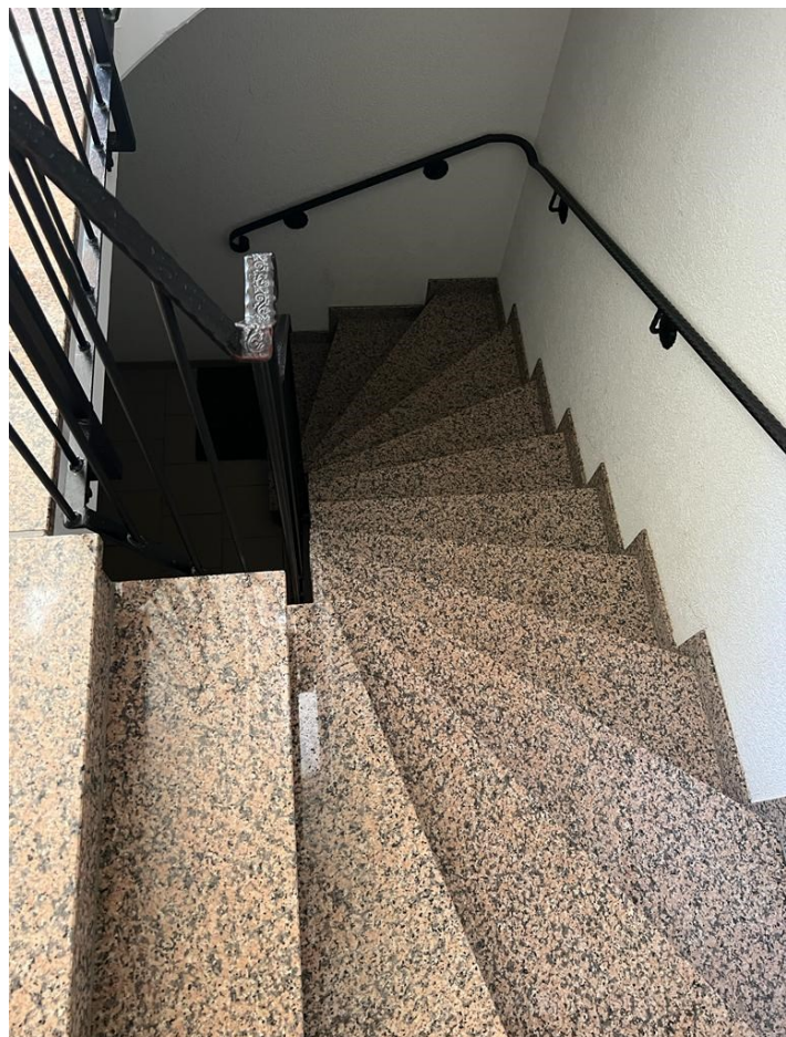
Ansicht Treppenhaus Wohnhaus