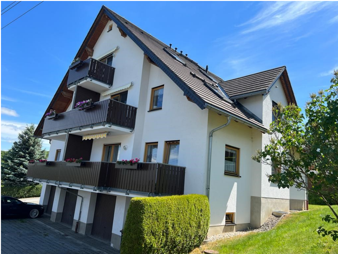
Frontansicht Wohnhaus mit Garagen