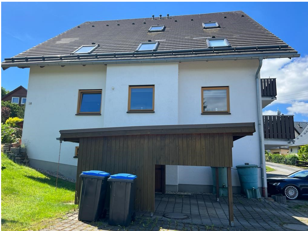
Seitenansicht Wohnhaus mit Carport