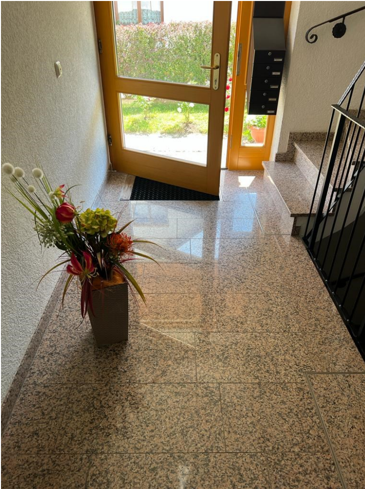
Ansicht Eingang Wohnhaus