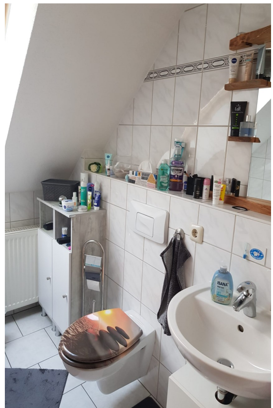
Teilansichten Bad / WC