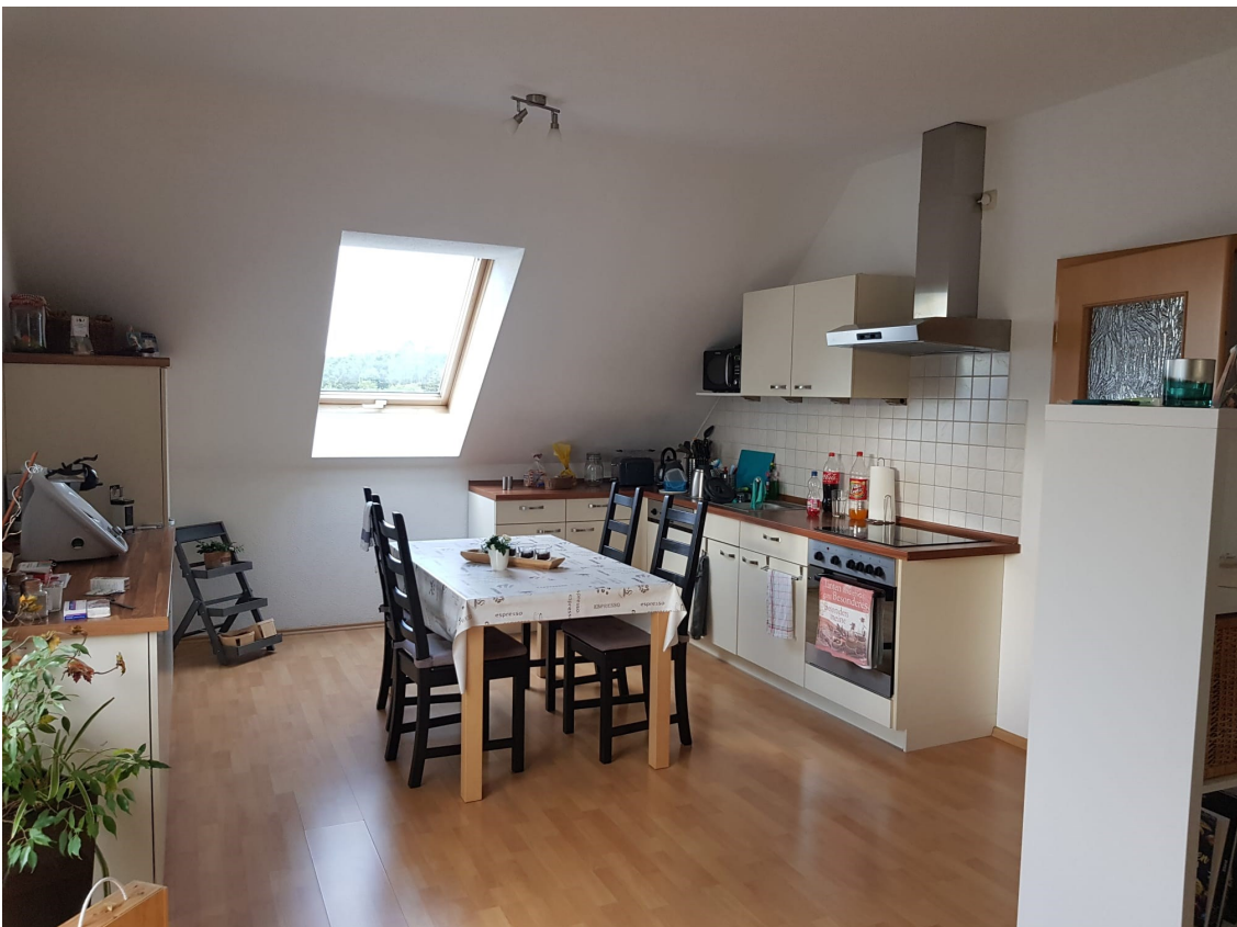
Ansicht Küchenzeile im Wohnzimmer