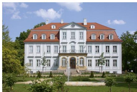
Stammhaus Schloss Güldengossa

Die Geiger Edelmetalle AG ist ein mittelständischer Familienbetrieb, der dem Handel mit hochwertigen Erzeugnissen aus Gold, Silber, Platin, Palladium und Kupfer verpflichtet ist. Die Geiger Edelmetalle AG ist Affiliate Member der LBMA.