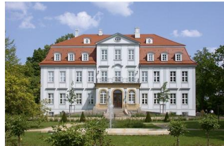
Stammhaus Schloss Güldengossa

Die Geiger Edelmetalle GmbH ist Affiliate Member der LBMA.